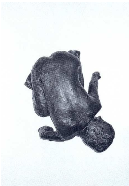
Obr. 3: Kiki Smith - Lilith (1994)