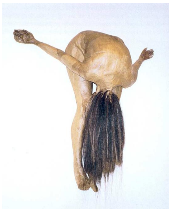
Obr. 4: Kiki Smith - Bez názvu (1995)