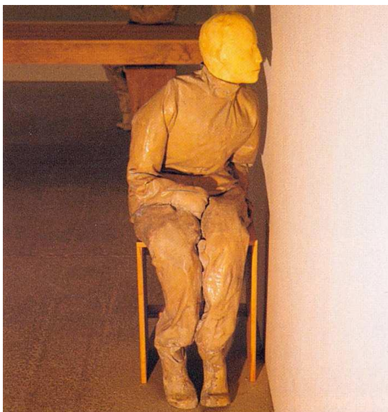
Obr. 1: Juan Muñoz - Miesto zvané cudzina (1996)